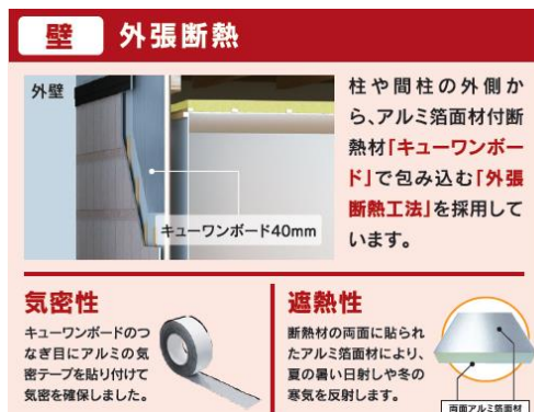
<外張断熱工法概要>